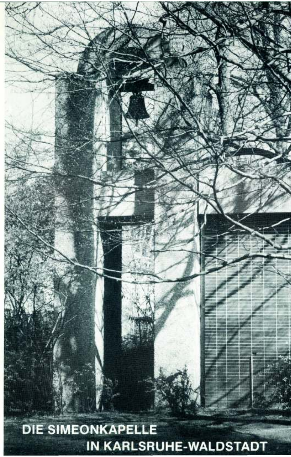
DIE SIMEONKAPELLE IN KARLSRUHE-WALDSTADT